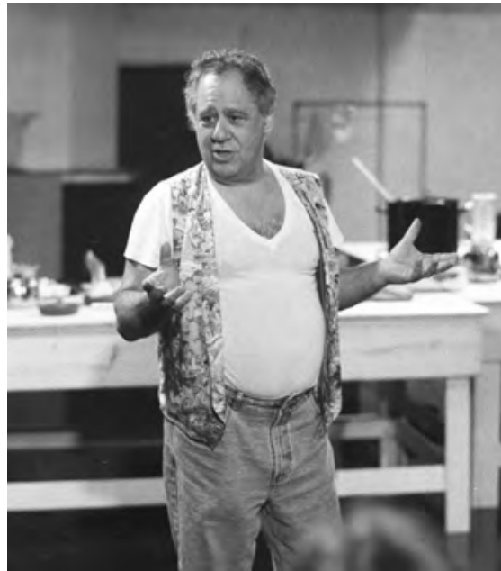
Richard Schechner durante el ensayo de una puesta en escena de su autoría, Nueva York, 1992

Uno de los autores que más contribuyó a establecer el campo de estudios del performance para las artes escénicas fue el ya citado Richard Schechner, quien se dio a conocer en la década de 1960 como director teatral con su legendaria compañía The Performance Group, con sede en la ciudad de Nueva York. Muy a tono con el espíritu de la época, el grupo realizó montajes experimentales que buscaban romper con la barrera actor/espectador, al grado de generar eventos donde los espectadores entraban al escenario e interactuaban libremente –algunos dirían promiscuamente– con los intérpretes.