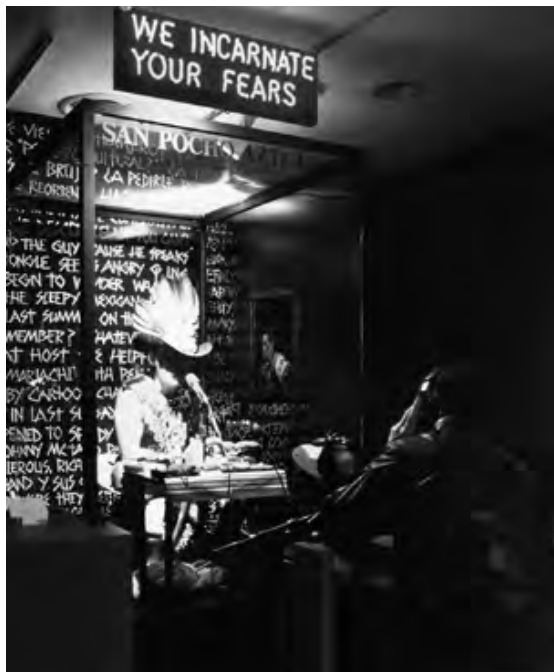
The Temple of Confessions , con Guillermo Gómez Peña, 1994

El teatro se constituye por conductas restauradas en tanto que trae al “aquí y ahora” de un montaje escénico historias, diálogos y personajes, tanto históricos como ficticios, imaginados en el pasado. En el caso del arte del performance o arte acción, muchos artistas se resisten a esta lógica (re)presentacional; sin embargo, su trabajo cabe en el esquema de Schechner toda vez que el artista se presenta ante el público en un estado “otro”; y aunque su performance sea autobiográfico o puramente simbólico, la acción se realiza con base en “secuencias de conducta” ya vividas u observadas. En este sentido, Schechner asume que hay distintos grados de conducta restaurada, desde aquella que pasa por completamente “original”, como los happenings de Allan Kaprow o las espontaneidades de la vida cotidiana. Es cierto que cada performance o actuación es diferente de otra, pero cada una se arma con una combinación de fragmentos de conductas realizadas en el pasado. Combinarlas y recombinarlas en infinitas variaciones genera una disposición o situación única. Es decir, la originalidad del evento no radica en el material que lo constituye, sino en la interactividad del propio material (Schechner, 2006: 35).